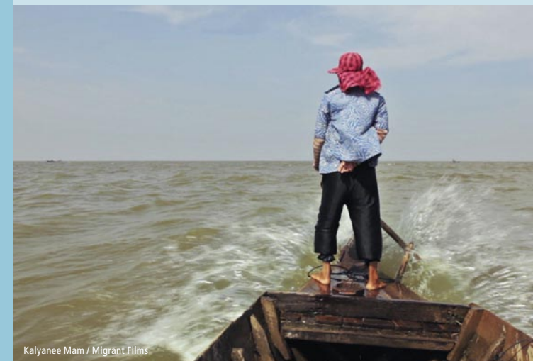
Kalyanee Mam / Migrant Films

20:30 – 22:00 A RIVER CHANGES COURSE (90 Min.) von Kalyanee Mam, USA 2013, OmengLU