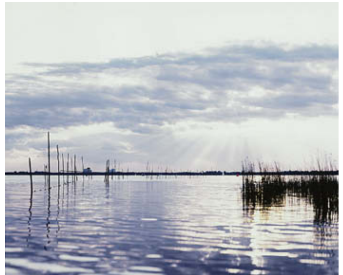
Der Große Müggelsee

Diese Pläne dienen als Instrumentarium zur Umsetzung der Maßnahmen in den Bundesländern bzw. in Teileinzugsgebieten und darüber hinaus in der gebündelten Berichtsform für das gesamte Flussgebiet der Berichtserstattung an die Europäische Union.